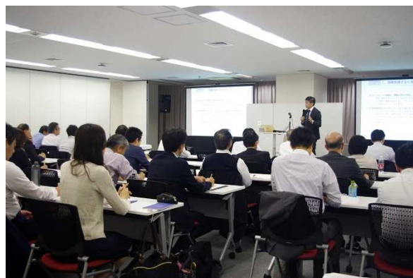
第1回目の講義の様子